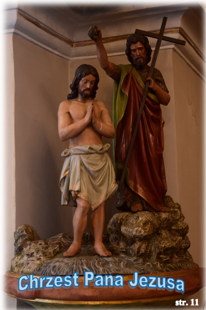
Chrzest Pana Jezusa