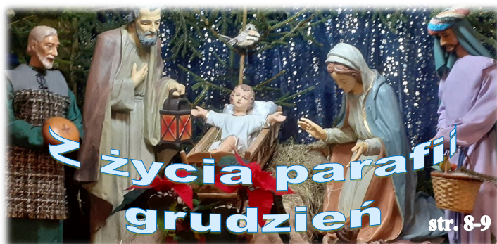
Życia parafii grudzień