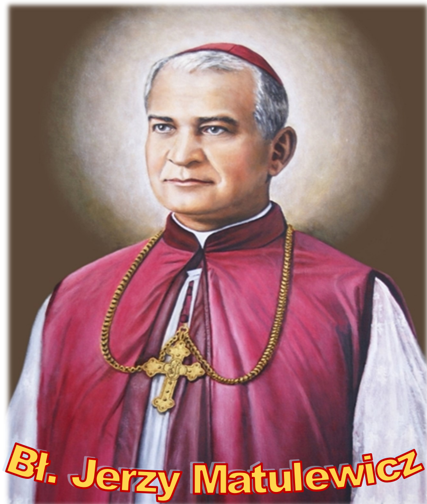
Bł. Jerzy Matulewicz